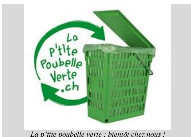
La p'tite poubelle verte : bientôt chez nous !