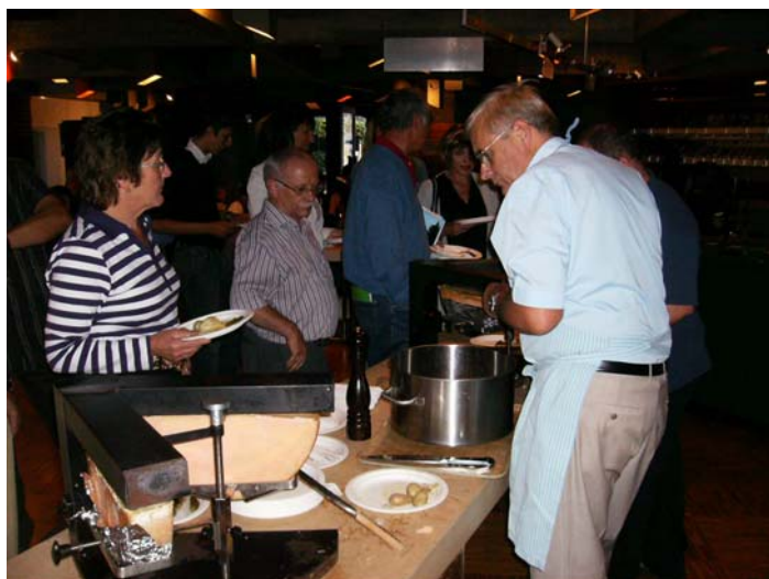
Un des maîtres racleurs

La Résidence compte au moins 50 personnes inscrites sur Facebook. Par ailleurs, plusieurs groupes Facebook sont susceptibles d'intéresser les habitants de la Résidence Apollo: