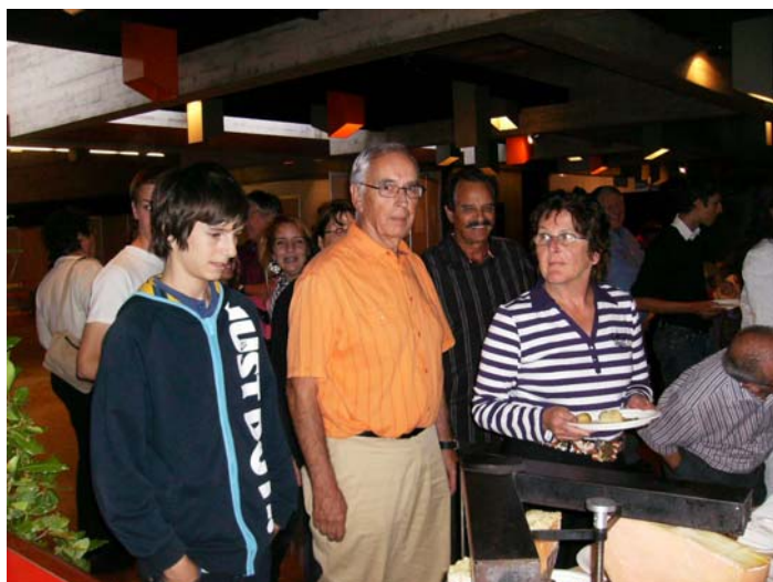
La queue pour la raclette