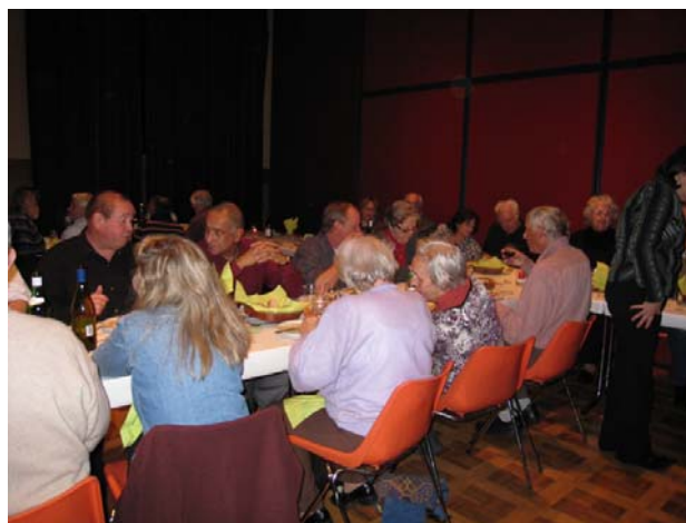
Quelques images de notre soirée de novembre 2009