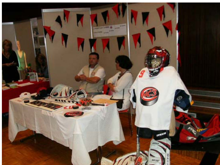
Stand du "Hockey Club 3 Chêne"