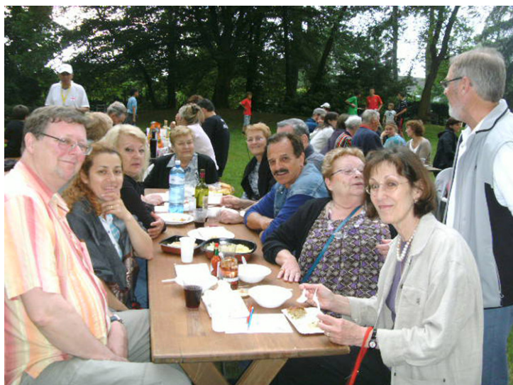
Des tables bien remplies