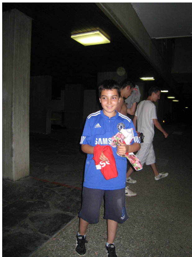
L'heureux jeune gagnant du concours