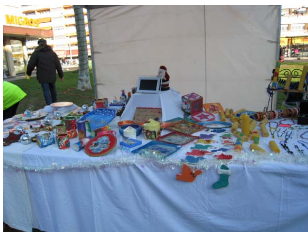
Quelques-uns des objets confectionnés par Tiffany