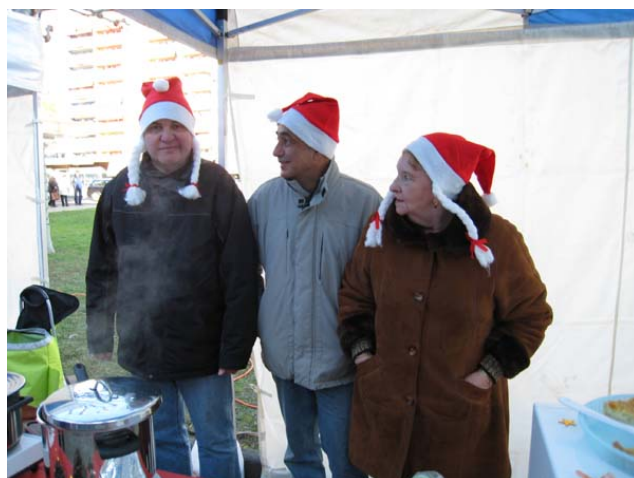
Le stand de vin chaud

Nous avons réalisé un bénéfice de près de CHF 500. Nos efforts ainsi que ceux des autres associations présentes ont permis à la Commune de Thônex de remettre, à l'AIPE, un chèque de CHF 3000.