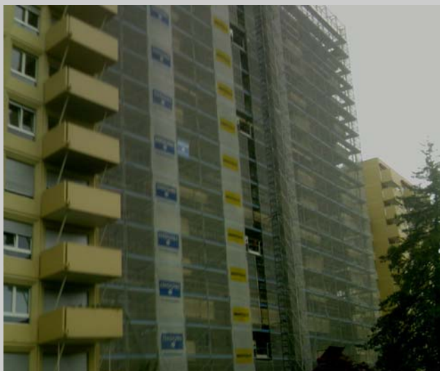
Travaux en cours aux 12 et 14 Adrien-Jeandin. Les deux-tiers de la Résidence auront ainsi été rénovés.

Les travaux de rénovation des façades des 12 et 14 Adrien-Jeandin sont en cours, après avoir été votés à l'unanimité lors d'assemblées générales extraordinaires tenues en novembre 2008. Il s'agit de travaux en tous points identiques à ceux effectués antérieurement aux 8, 16 et 18 Adrien-Jeandin, réalisés par la même entreprise et sous la direction du même bureau d'ingénieurs. La voie qui avait été ouverte en fin 2006 par le 16 Adrien-Jeandin a donc fait école y compris - et il est piquant de le relever - auprès de ceux-là même qui accusaient alors le 16 Adrien-Jeandin de "faire cavalier seul."